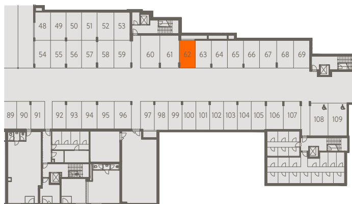
2. PP | 2nd basement

*Podlahová plocha je vypočtena podle nařízení vlády č. 366/2013 Sb. jako půdorysná plocha ohraničená vnitřními stranami obvodových zdí bytu včetně půdorysné plochy všech svislých nosných i nenosných konstrukcí uvnitř bytu. Nezahrnuje balkony, lodžie, terasy, předzahrádky a jiné zpevněné plochy.